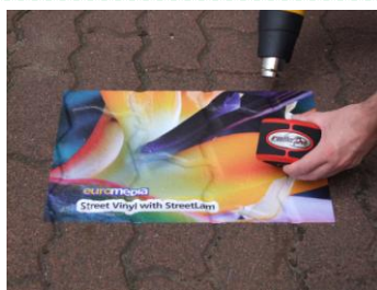
Изготовление напольной графики для кратко- и среднесрочного использования на грубых поверхностях

Euromedia Street Laminate – предназначен для использования в сочетании с Euromedia Street Vinyl на грубых внутренних и наружных поверхностях и имеет высокую устойчивость к царапинам и отпечаткам следов. Street Laminate защищает отпечаток от истирания и грязи, имеет противоскользящую поверхность (сертификаты по стандартам ASTM и DIN 51130). Благодаря антибликовой поверхности рекламное сообщение легко читается. Поверхность может подвергаться машинной очистке.