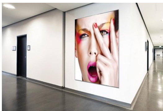
Плакаты, презентации, торговые панели, декоративные элементы для стен

Euromedia Solvent Photo satin – фотобумага на основе полиэстера, с многослойным покрытием, предназначенная для печати сольвентными и УФ-закрепляемыми чернилами. Обладает высокой белизной, является погодоустойчивой и водонепроницаемой, возможно применение холодной ламинации